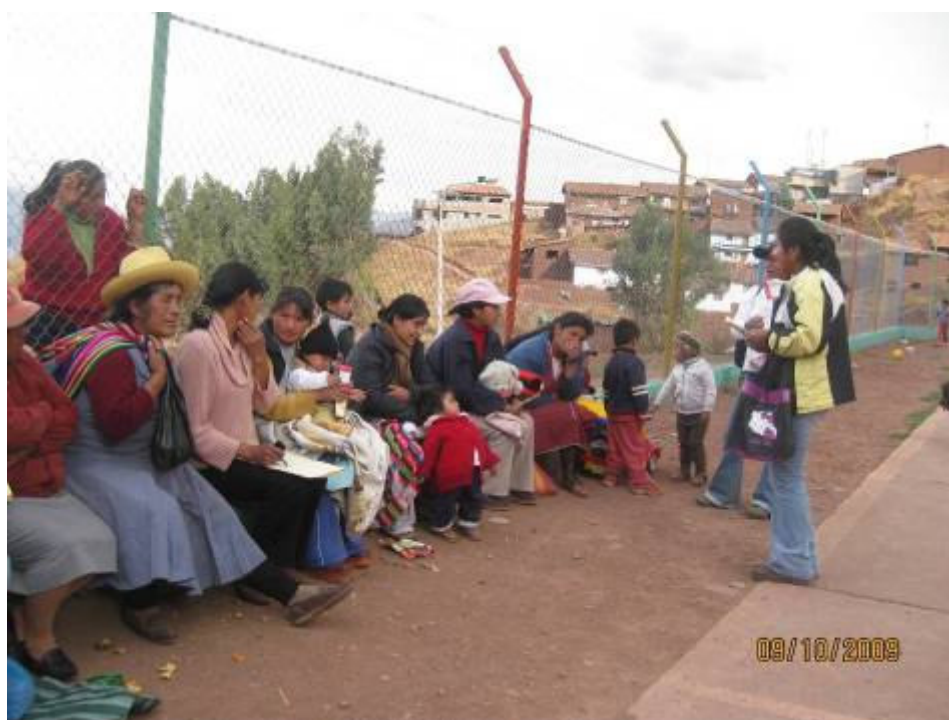
Foto Nº 6: Coördinatie met moeders van het melkprogramma voor deelname aan de diagnose