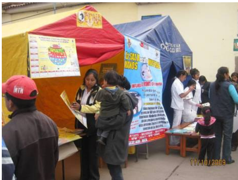
Foto Nº 5: Deelname aan promotiecampagne in district Santiago